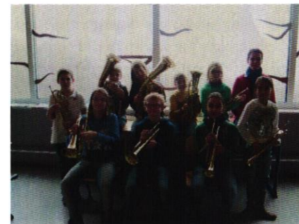
Trompeten und Tenorhörner

Für die Einrichtung einer Bläserklasse spricht zudem, dass in der Regel die Identifikation mit dem Orchester und den gemeinsamen Zielen höher ist als in einer bunt zusammengewürfelten Gruppe von Schülern aus unterschiedlichen Klassen, die sich nur einmal die Woche trifft. Auch das Gemeinschaftsgefühl ist häufig innerhalb einer Klasse stärker, was sich positiv auf die Klassengemeinschaft auswirkt. So kann beispielsweise auch die Klassenleiterstunde ab und zu genutzt werden, um gemeinsame Auftritte zu planen.