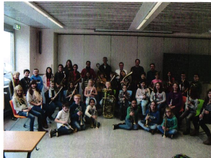
Klassen 6d und 6e Musiklehrer und Instrumentalpädagogen